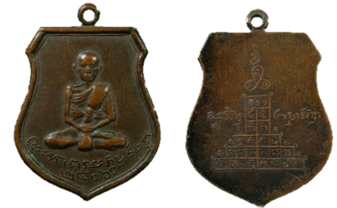
เหรียญหลวงพ่อกุ่ม วัดฝาง รุ่นแรกปี 06

ได้ล้มป่วยด้วยโรคทางเดินหายใจ ทำให้ไอบ่อยมาก ตลอดจนเวลาในการจำวัดแทบไม่มี เพราะมีผู้คน เดือดร้อนมาขอความช่วยเหลือเป็นจำนวนมาก ทำ ให้สุขภาพหลวงพ่อดีลงจนผ่ายผอม ท่านได้ละ สังขารในวันเสาร์ที่ 5 พ.ศ.2510 ปีมะเมีย คล้อยจาก วันฉลองอายุครบ70ปีไม่กี่วัน ท่านมรณะในเรือหาง ยาวพุทธิญาณโณ ของท่านด้วยอาการสงบท่ามกลาง ความโศกเศร้าของศิษยานุศิษย์ที่ตามปรนนิบัติไม่ ห่าง