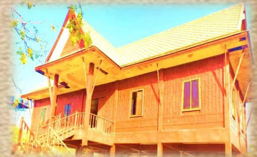
งานประเพณีสัมพันธ์ สำนักปลัด