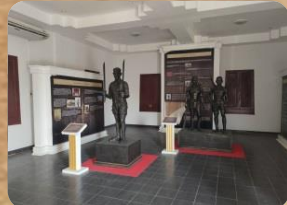
ภายในศูนย์ประวัติศาสตร์แขวงเมืองวิเศษไชยชาญ