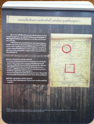
ภาพแผนที่เส้นทางเดินทัพในสมัยกรุงศรีฯ