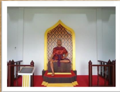
เจ้าพระยาที่มาตั้งทัพบ้านจวน