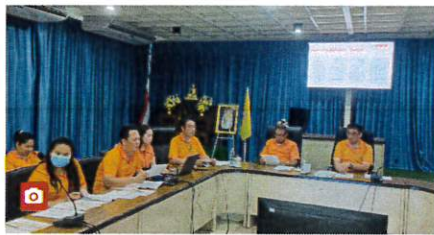
กิจกรรมเสริมสร้างและส่งเสริมจริยธรรมแนวทางปฏิบัติงานตาม มาตรฐานจริยธรรมของหน่วยงาน ประจำปีงบประมาณ พ.ศ. 2567 ในวันที่ 7 ธันวาคม 25...